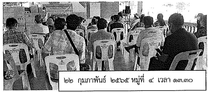
๒๒ กุมภาพันธ์ ๒๕๖๕ หมู่ที่ ๔ เวลา ๑๓.๓๐