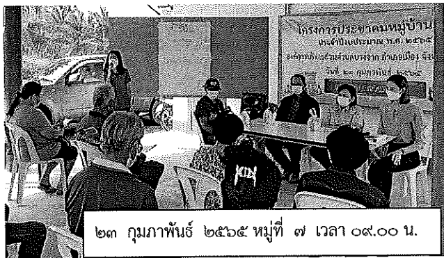
๒๓ กุมภาพันธ์ ๒๕๖๕ หมู่ที่ ๗ เวลา ๐๙.๐๐ น.