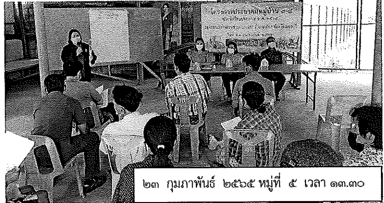
๒๓ กุมภาพันธ์ ๒๕๖๕ หมู่ที่ ๕ เวลา ๑๓.๓๐