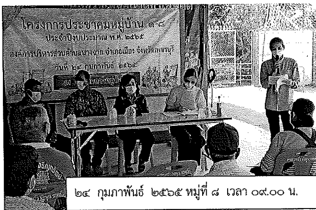
๒๔ กุมภาพันธ์ ๒๕๖๕ หมู่ที่ ๘ เวลา ๐๙.๐๐ น.