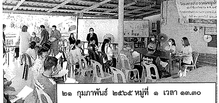
๒๑ กุมภาพันธ์ ๒๕๖๕ หมู่ที่ ๑ เวลา ๑๓.๓๐