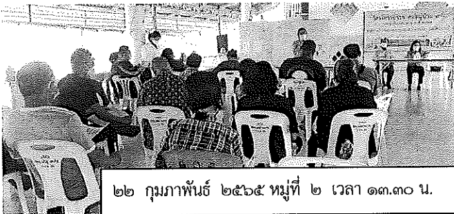
๒๒ กุมภาพันธ์ ๒๕๖๕ หมู่ที่ ๒ เวลา ๑๓.๓๐ น.