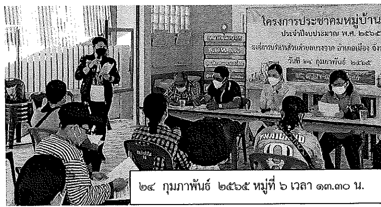
๒๔ กุมภาพันธ์ ๒๕๖๕ หมู่ที่ ๖ เวลา ๑๓.๓๐ น.