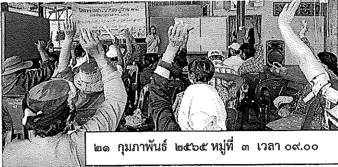
๒๑ กุมภาพันธ์ ๒๕๖๕ หมู่ที่ ๓ เวลา ๐๙.๐๐